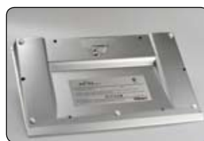
Griffflächen für eine sichere und bequeme Handhabung